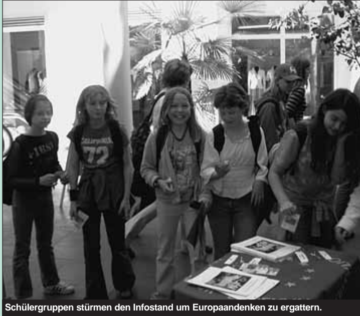
Schülergruppen stürmen den Infostand um Europaandenken zu ergattern.